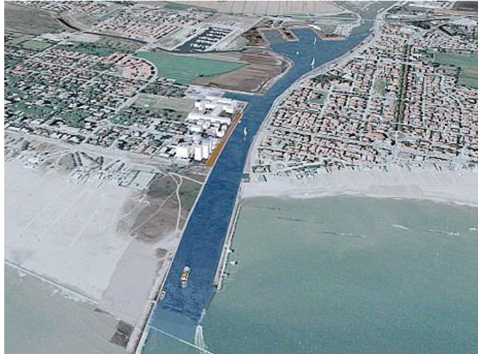
I lavori per l'idrovia a Porto Garibaldi