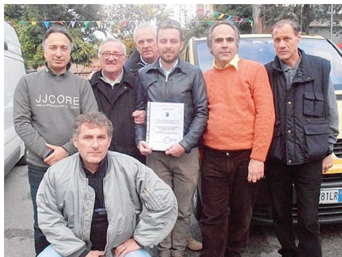
I volontari partiti da Comacchio per portare aiuti in Bosnia

Quattro volontari sono partiti con due furgoni per dare speranza