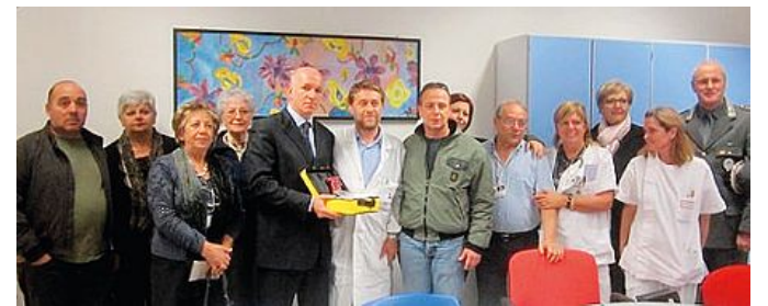
I partecipanti all'incontro durante il quale è avvenuta la donazione