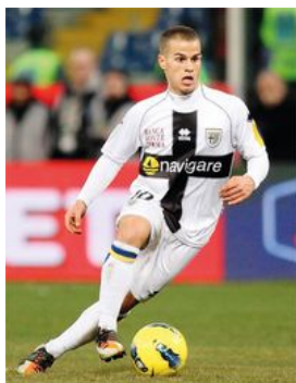
Giovinco, alias la Formica Atomica, sembra destinato a intraprendere la stessa strada percorsa da Zola

Lippi. Il Guangzhou Evergrande, la squadra di Canton che detiene il primo e finora unico titolo della Chinese Super League, il massimo torneo calcistico della Repubblica Popolare, ha ufficializzato l'ingaggio di Marcello Lippi per due anni e mezzo. Ingaggio da 25 milioni di euro.