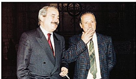
Giovanni Falcone e Paolo Borsellino