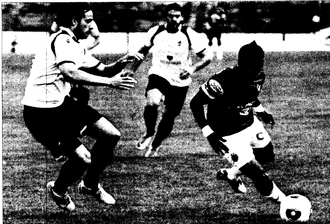
Una imagen del Constança-Nàstic, encuentro bajo sospecha de amaño.

la lucha contra los amaños ("España es el país más comprometido del mundo", dijo Baranca) y explicó cómo todas las semanas la LFP escruta los 21 partidos que se disputan (Primera y Segunda) con múltiples dispositivos de monitorización y con acceso casi instantáneo a los movimientos de apuestas que se van generando. "Si desde Federbet nos han advertido de un posible arreglo estudiamos todas las jugadas dudosas, como goles en propia puerta, fallos de porteros o así, que puedan contribuir al resultado extraño apostado, y viceversa, si observamos alguna de estas jugadas raras, inmediatamente comprobamos si se ha producido un movimiento extraño de apuestas. En los casos en que concluyamos que el amaño ha sido probable abrimos procesos disciplinarios y lo denuncia-